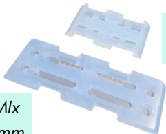
SELABROCA 4 Brocas 26X6 mm

O SelaMix é utilizado para o armazenamento e esterilização de 4 brocas padrão tamanho de até 50mm de comprimento por 8mm de diâmetro.